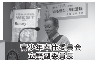
青少年奉仕委員会 立野副委員長